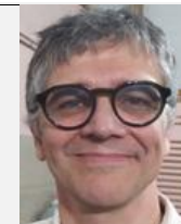
M Le Maire