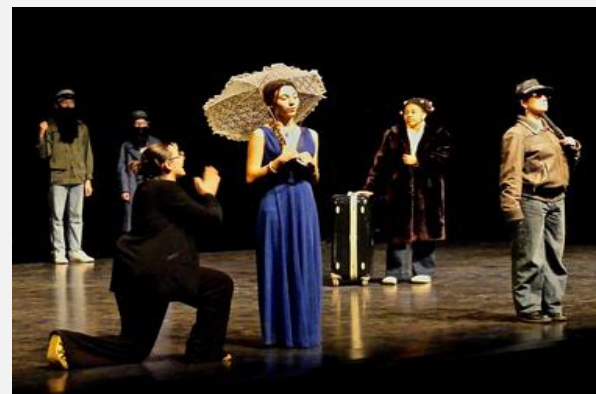
"Le Roi nu" Lycée Georges Clemenceau de Nantes Enseignant : Sylvain Thébault Intervenant : Emerick Guezou / Cie Bougies noires