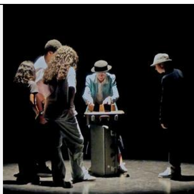
"C'est où qu'on va ?" Coll. Gutenberg de St-Herblain Enseignants : Sozic Comte et Gwénaél Gautier Intervenant : Pablo Gravouille/Cie Loma Sound design