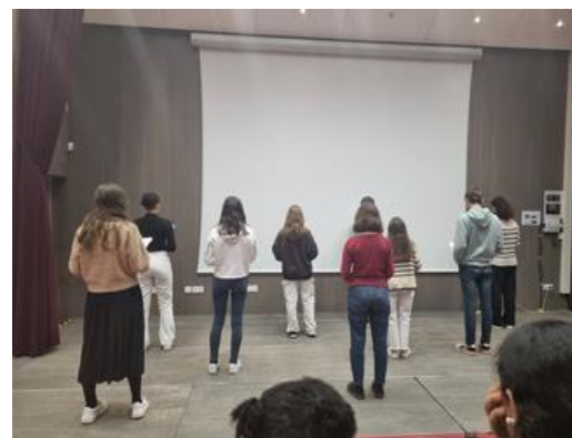
Des élèves du lycée CAMUS