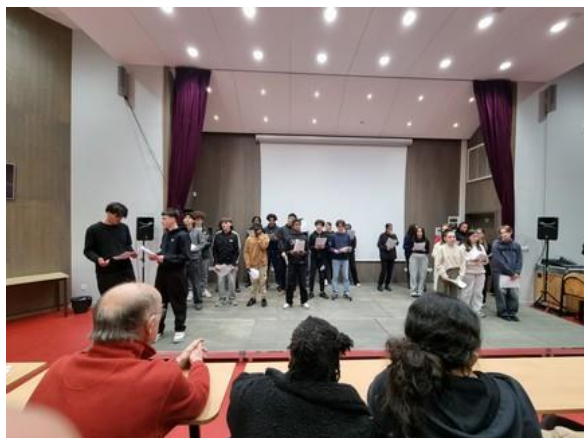
Des lycéens du Lycée Camus