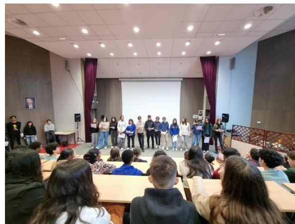
Des collégiens du Collège de Chantenay