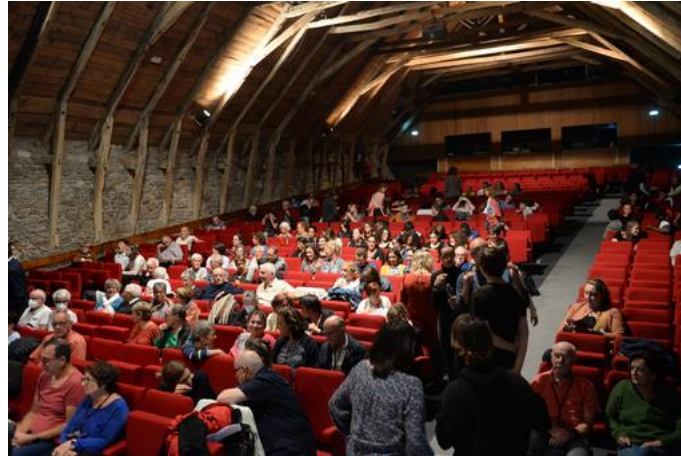
Dans la salle des Salorges

Ils étaient, là, plus de 200, de 12 à 84 ans : des collégiens, des lycéens, des enseignants, des comédiens, des parents des 5 départements des Pays de la Loire, invités 40 ans plus tard par COMETE 44, En Jeu 49, AMLET 53, TPA 72 et Vents et Marées 85.