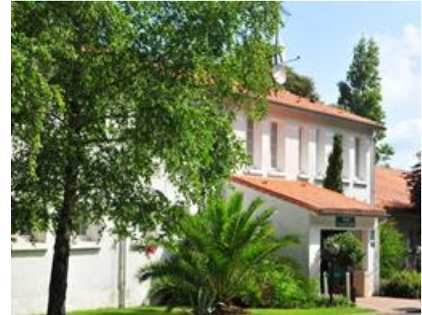
Dans le Centre des Quatre Vents