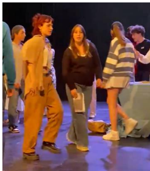
Au Palais des Congrès du Mans